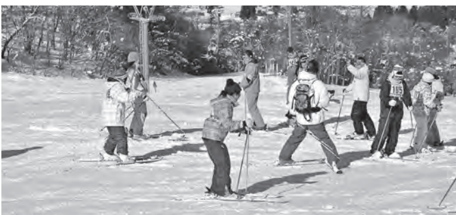
親子で楽しんだスキー教室

神楽は、昭和47年に地元の円万寺神楽をもとに演舞されるようになり、先輩から後輩へ50年以上踊り継がれています。地域の保存会の皆様からのご指導、PTAの協力をいただきながら、体育祭や文化祭、地区民運動会等で披露しています。また、東日本大震災では被災地を訪問し披露させていただいたほか、令和3年には全国中学校総合文化祭岩手大会にて演舞させていただきました。 2月には、親子スキー教室を開催しています。地域にある鉛温泉スキー場に行き、PTAや地域の指導者からレッスンを受けます。地域にある資源を最大限に活用し冬場のスポーツを親子で楽しんでい