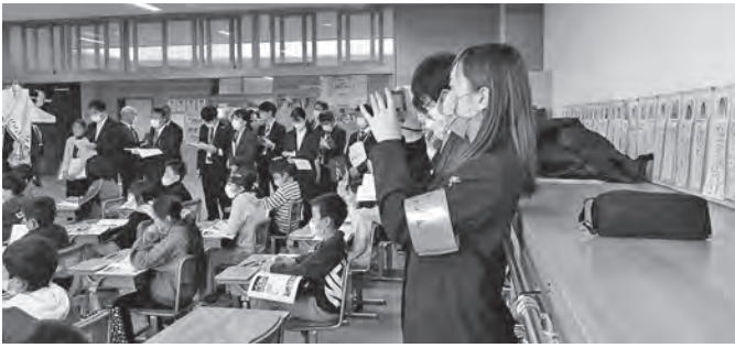
学校公開研究会では多くの保護者の協力をいただきました

滝沢中央小学校は令和元年度に開校した新しい学校です。滝沢小学校と鶴飼小学校の大規模化を解消し、それぞれの教育環境をより適切なものとするため滝沢市内9番目の小学校として平成31年4月1日に開校しました。開校した年の年度末にコロナ感染症感染防止のための緊急事態宣言が出たこともあり、思うようにPTA活動ができない部分もありました。しかし、できることを少しずつ手探りで進めてきた状況です。 今年度は感染対策をしながら、可能な限りPTA活動を実施してきました。新しい取り組みとして、睡眠の大切さを保護者に実感してもらおうと教養部が講師を招いて「快眠講座」を開催しました。また、今年、ICTの活用をテー