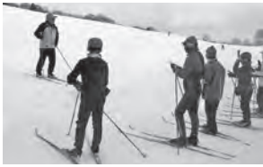
クロスカントリースキー 実技指導の様子

この度、七ツ森小学校PTAが文部科学大臣表彰の栄誉をいただきましたこと、関係各位に感謝申し上げます。