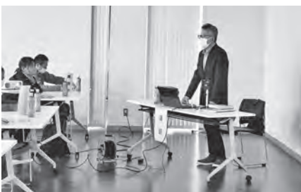
3年ぶりに参集型の研修会を実施しました