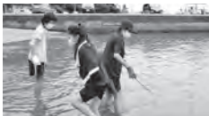
越喜来中から引き継いだ海岸清掃