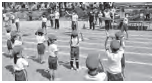
運動会でのPTA活動 運営補助と応援合戦審査

ます。地域にできた学校という事で、当時から保護者や地域の方より、惜しみないご支援とご協力を頂いてきました。今回の受賞は歴代PTA会員の皆様の活動が評価されたものと考えています。