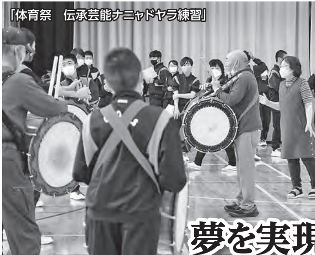
「体育祭 伝承芸能ナニヤドヤラ練習」