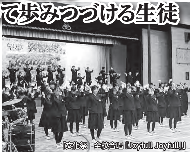
「文化祭 全校合唱『Joyfull Joyfull!』」