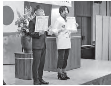
青山小PTAと見前中PTAが代表で受領しました