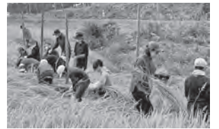
児童・保護者・地域の方との稲刈り