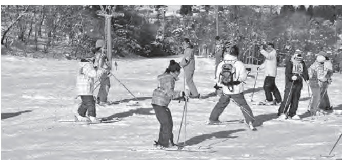
親子で楽しんだスキー教室

神楽は、昭和47年に地元の円万寺神楽をもとに演舞されるようになり、先輩から後輩へ50年以上踊り継がれています。地域の保存会の皆様からのご指導、PTAの協力をいただきながら、体育祭や文化祭、地区民運動会等で披露しています。また、東日本大震災では被災地を訪問し披露させていただいたほか、令和3年には全国中学校総合文化祭岩手大会にて演舞させていただきました。 2月には、親子スキー教室を開催しています。地域にある鉛温泉スキー場に行き、PTAや地域の指導者からレッスンを受けます。地域にある資源を最大限に活用し冬場のスポーツを親子で楽しんでい